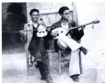
Εικ.4. Αυγόσχημος ταμπουράς & Βιολόλυρα

Επιπλέον πολλοί οργανοπαίκτες στην Κρήτη ειδικά πριν την επικράτηση του λαούτου κατασκεύαζαν σκαφτά ταμπουροειδή όργανα για να συνοδεύουν τη λύρα Εικ. 4. 16