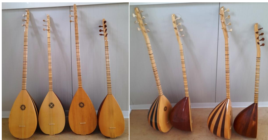
Εικόνα 1. Ταμπουράδες μαθητικοί μικρού μεγέθους

Ο ταμπουράς είναι ένα αχλαδόσχημο μουσικό όργανο, με μικρό αντηχείο (σκάφος), μακρύ βραχίονα ο οποίος φέρει κινητούς δεσμούς ή «μπερντέδες» και έχει τρεις ομάδες χορδών που είναι τεντωμένες κατά μήκος του οργάνου και παράλληλες προς αυτό και οι οποίες νύσσονται (παίζονται) με πένα. 1 Το σκάφος του ταμπουρά κατασκευάζεται είτε από μονοκόμματο ξύλο το οποίο σκάβεται, είτε από «ντούγκες», λωρίδες ξύλου που κολλιούνται μεταξύ τους πάνω σε ένα καλούπι για να πάρουν το επιθυμητό σχήμα. Τα κλειδιά ή στριφτάρια είναι ξύλινα και σφηνώνουν στο πάνω μέρος του βραχίονα. 2