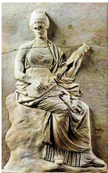
Εικ. 2. Μούσα με τρίχορδο ανάγλυφο από βάση αγάλματος από τη Μαντίνεια του 320 π.Χ., Εθνικό Αρχαιολογικό Μουσείο Αθηνών.

Οργανολογικά ο ταμπουράς εντάσσεται στη μεγάλη οικογένεια των λαούτων. 8 Στα